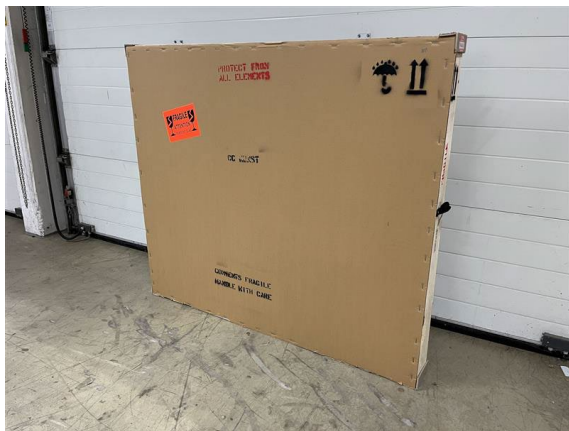
Gesamtverpackung mit Kennzeichnung